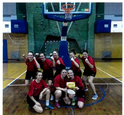
Basketbalistky ze „zdravky“ válí – ve Svitavské stredoškolské lize nenašly přemožitelky a staly se vítěžkami této soutěže.