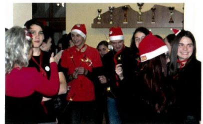
Poslední vyučovací den v prosinci se schází studenti s pedagogy, aby si na školních schodech zazpívali vánoční koledy .