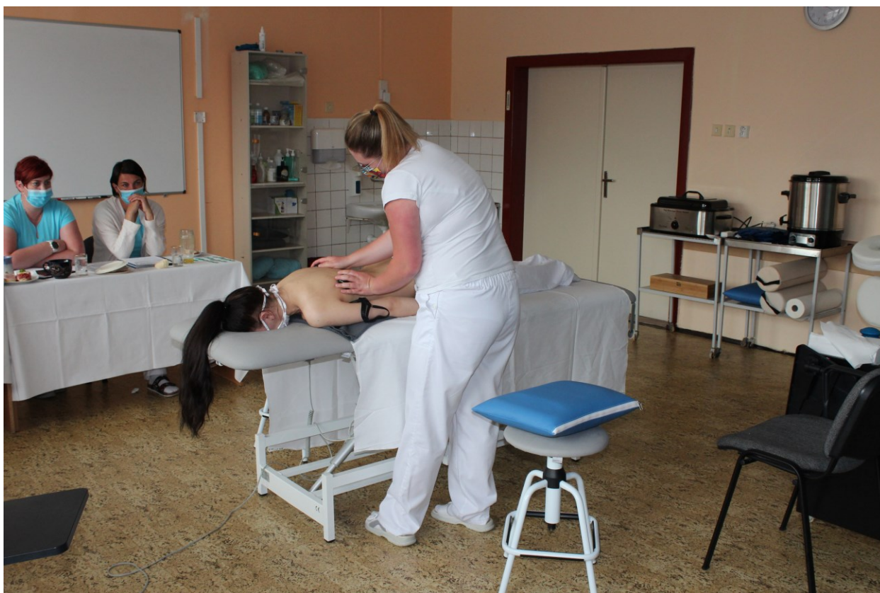
Obor Masér sportovní a rekondiční