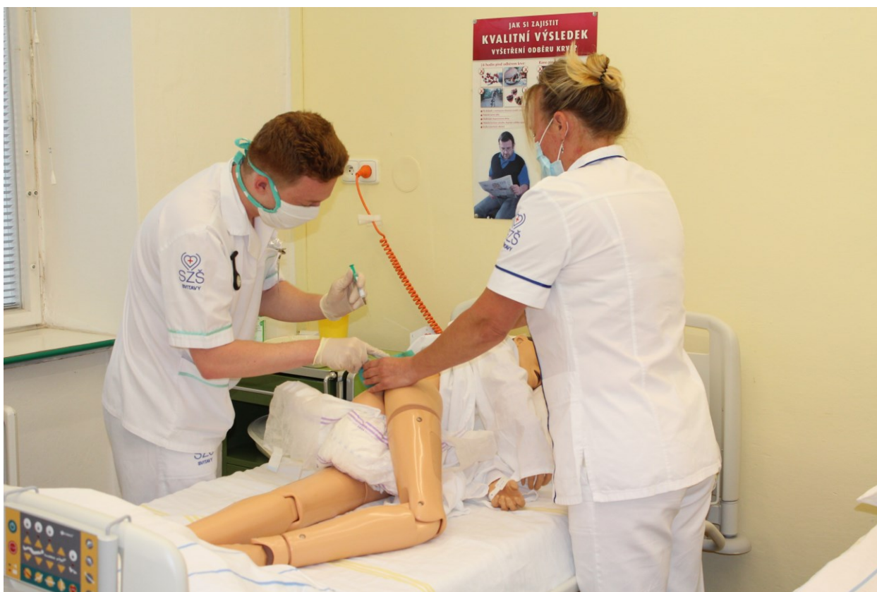
Obor Zdravotnický asistent