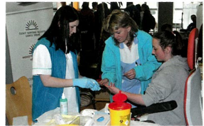
Na Dnech zdraví ve Svitavské nemocnici studenti zdravotnické školy uplatní na jednotlivých stanovištích dokonale své praktické znalosti .