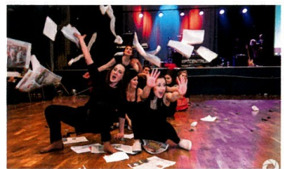
Maturitní plesy v kulturním centru Fabrika bývají tradičním vrcholem školní společenské sezony.